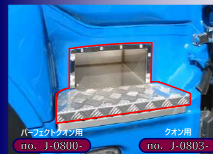
パーフェクトクオン用 no. J-0800-